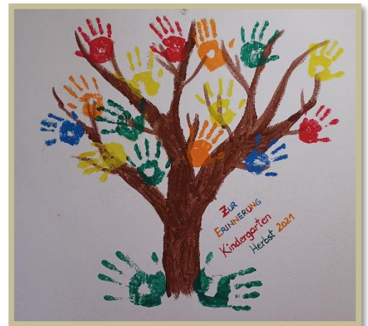
Erinnerung im Feuerwehrhaus, dass wir da waren.

Im September starteten wir mit 15 Kindern in das neue Kindergartenjahr, diesmal im Mehrzweckhaus der Feuerwehr, da im Kindergarten noch die letzten kleineren Bauarbeiten anstanden. Wir fühlten uns in der Feuerwehr sehr wohl und durften auch bei dieser Gelegenheit die Feuerwehrzeugstätte und besonders das Feuerwehrauto genauer betrachten. Wir bedanken uns herzlich bei Lois und Manfred für den netten Vormittag in der Feuerwehr!