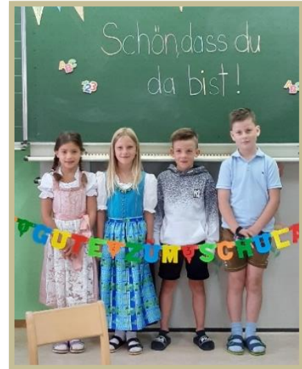
4 KINDER IN DER 2. SCHULSTUFE