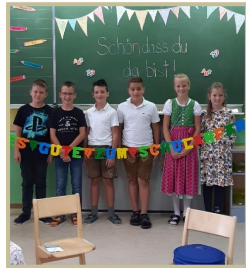
6 KINDER IN DER 4. SCHULSTUFE