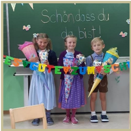
3 KINDER IN DER 1. SCHULSTUFE

Die Volksschule Weißpriach besuchen heuer: