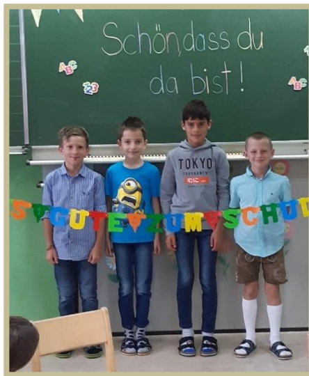
4 KINDER IN DER 3. SCHULSTUFE